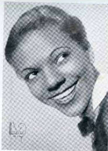
IVIE ANDERSON Vocalist